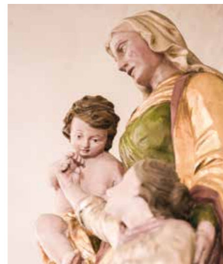
Selbdritt-Statue in Groß Gerungs

Anna und Maria mit dem Jesuskind im südlichen Seitenschiff: In dieser Ausgabe widmen wir uns der Heiligen Anna - in der nächsten Ausgabe werden wir von der Mutter Gottes berichten.